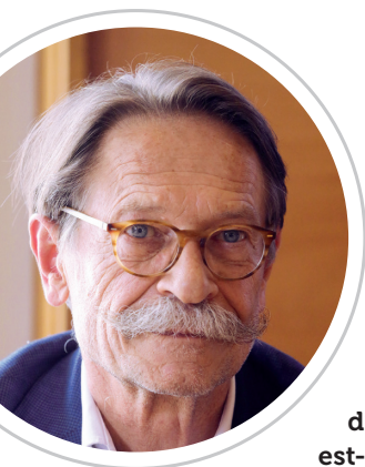
Luc Duquesnel Président des Généralistes-CSMF