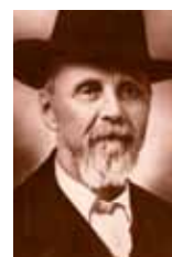
A. T. STILL

La « MMO » est admise à l'université depuis les années cinquante et reconnue par l'Académie de Médecine et l'Ordre des médecins. Depuis plusieurs années, l'ostéopathie entre dans les services de rhumatologie, de rééducation et de chirurgie traumatologique des CHU. L'ostéopathe, docteur en médecine, ODM, avec sa vision globale de l'individu et ses traitements peu invasifs complète harmonieusement l'approche plus organique des médecins et chirurgiens universitaires.